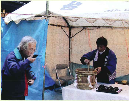
▲ どぶろくを振る舞う氏子と味わう参拝客