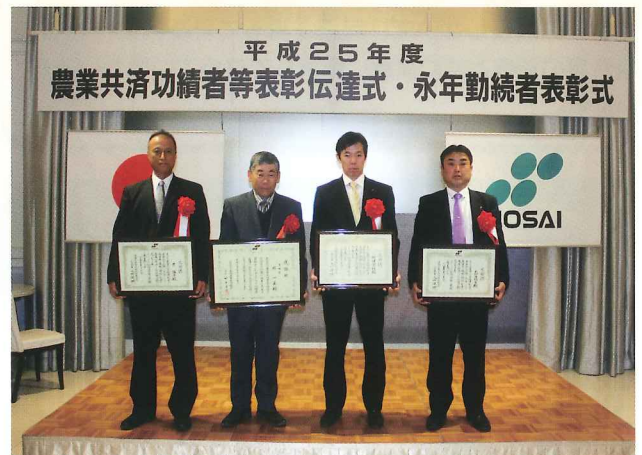
▲ 左より原氏・坏氏・新堀氏・大和田氏