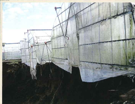
▲土砂崩れでむき出しになった施設