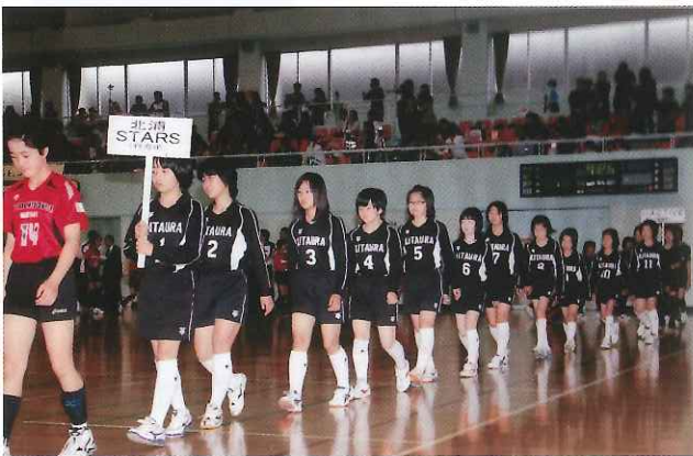
▲ ファミリーマートカップ茨城県大会出場