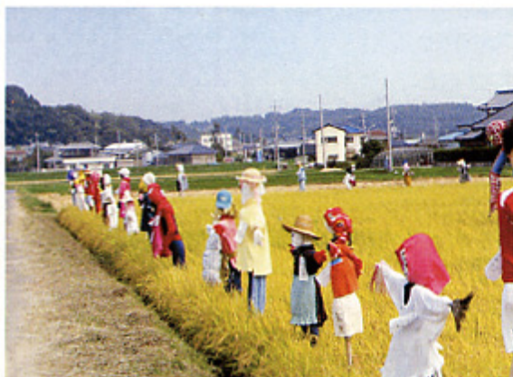
かかしとは思えない力作が並ぶ圃場

雨にも風にも負けず、すくすくと育った稲（ゆめぴち）は、9月22日に先生や保護者と一緒に楽しく稲刈りが行われました。児童たちはカマを持って、一生懸命刈り取り、学校内では学べない貴重な体験をしました。 後日、糶摺りがされ約20aの圃場で22俵もの米がとれ、大豊作でした。