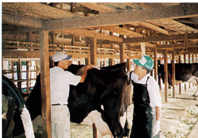
▲乳牛の検査を実施する獣医師（妊娠鑑定）

この事業は国指定と、共済組合主体の二つがあり、国指定は特定損害防止事業といって、獣医師の指導のもと乳牛・肉用牛の特定の病気の早期発見・未然防止を中心に行い、組合主体のものは、一般損害防止事業として病気の予防を目的として家畜全般にわたり実施しています。