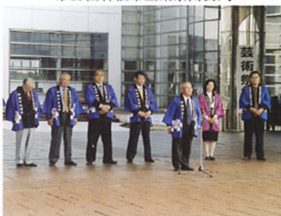
第29回神栖市産業祭開会式

ステップアップ運動の推進活動として、組合のPRを目的とした地域イベント等への参画を実施いたしました。 本年度は神栖市合併後、会場を統一した初の産業祭で10月28日、29日の2日間、会場は3万5千人でにぎわい、子供たちへ風船の無料配布(一五〇〇個)を行い、地域住民との交流を深めました。