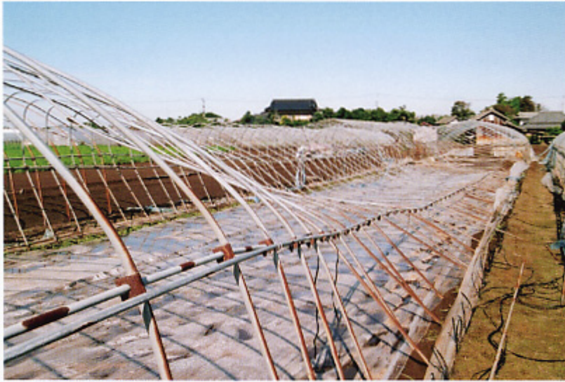
暴風雨によってパイプ本体まで被害を受けたハウス

10月6日～7日にかけて台風16号・17号を伴った低気圧（銚子気象台発表・最大瞬間風速37・6m）が太平洋沿岸を通過し、今までに例のない長時間（約30時間）に亘る暴風雨の影響を受け、平成16年10月に相次いで上陸した台風22号・23号を上回る大災害をもたらした。