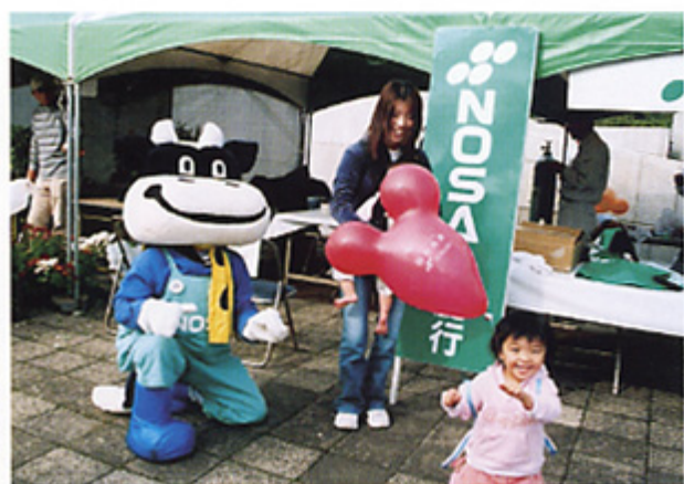
ノーサイくんといちいち

ステップアップ運動の推進活動として、組合のPRを目的とした地域イベント等への参画を実施いたしました。 本年度は神栖市合併後、会場を統一した初の産業祭で10月28日、29日の2日間、会場は3万5千人でにぎわい、子供たちへ風船の無料配布(一五〇〇個)を行い、地域住民との交流を深めました。