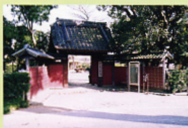
赤門の名で親しまれる表門