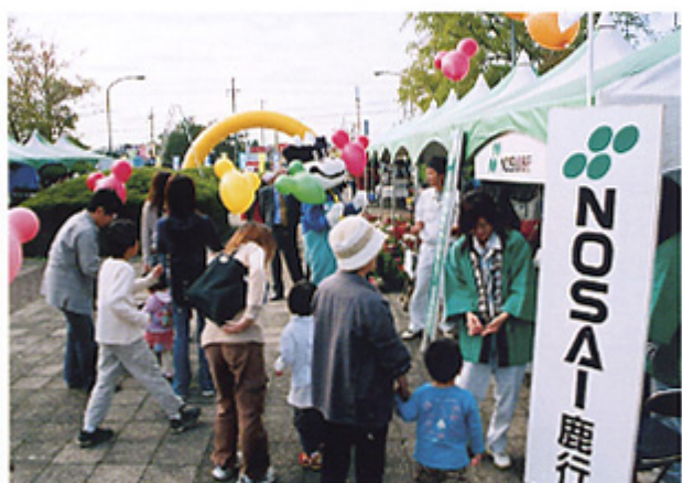
子供たちに風船を配布する様子