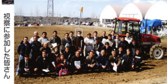
視察に参加した皆さん

担い手農家等支援事業の一環として、去る2月28日、関係機関を含む31名の参加により、稲敷郡美浦村にある「スガノ農機株式会社」を訪問、視察研修会を実施しました。