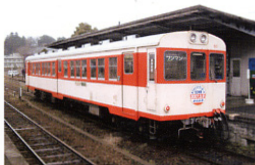
現役最古の気動車だった キハ600形601

特に今年に入ってから、沿線には別れを惜しむ鉄道ファンが連日に渡り、最後の雄姿を残そうとカメラを構えていました。週末には2両編成での運転で対応もしていました。それでも乗り切れないほどの賑わいをみせていました。